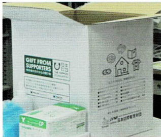
N訪問看護ステーション (S県)