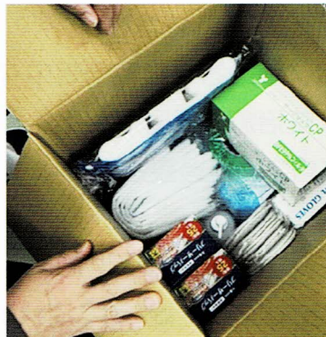
K訪問看護ステーション (D県)