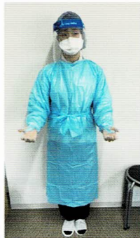
訪問看護ステーションハートフリーやすらぎ (大阪府)