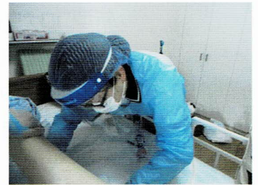
訪問看護ステーションおおみち (大阪府)