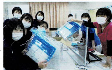
訪問看護ステーション豊 (静岡県)