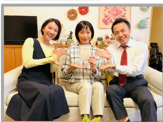
働き盛り世代(壮年期)編 ～みどりの見える街で～ 12:15～12:30