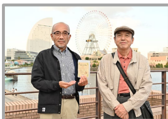
総りの世代(高齢期)編 ～みなとの見える街で～ 13:30～13:45