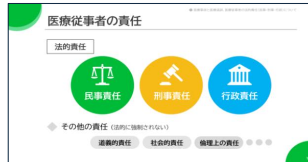
図2 番外編 「医療事故における法的責任」より一部抜粋

厚労省保険局医療課より発出(令和8年3月31日付) 「疑義解釈資料について(その2)」(別添6)より一部抜粋