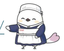
大関和版 ピンポンちゃん

https://www.jvnf.or.jp/houkan-project2026/